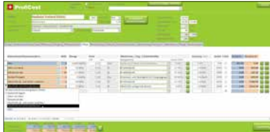
Einblick in die Software ProfiCost.

Nicht zuletzt um die Resultate der Arbeiten der AG Betriebswirtschaft in der Praxis bekannt zu machen, organisierte die SZG in Zusammenarbeit mit den Fachstellen für Gemüsebau der Kantone BE und FR am 20./21. September die 4. Unternehmertagung Gemüse Schweiz. Unter dem Titel «Ressourcenschonend produzieren – rentiert das?» warteten auf Betrieben im Seeland spannende Präsentationen, Informationen und Resultate zu aktuellen Projekten in Produktion und Vermarktung auf die über 50 Teilnehmer.