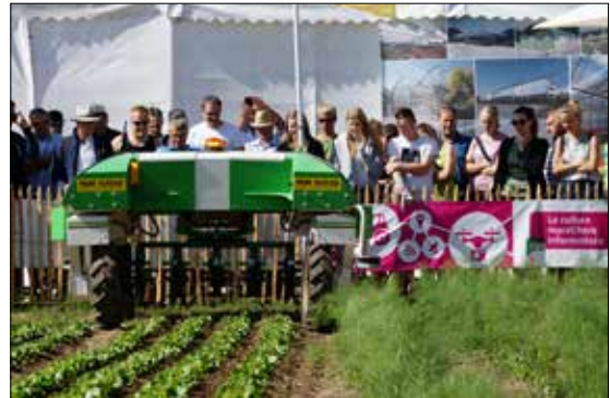
ÖGA-Sonderschau «Gemüsebau per Mausclick».

Vom 27.-29.06.2018 feierte die ÖGA – die grösste Schweizer Fachmesse der grünen Branche – mit ihrer 30. Ausgabe ein Jubiläum. Über 430 Aussteller stellten auf 12ha Ausstellungsfläche fast 22'000 Besuchern ihre neusten Innovationen vor. Die SZG trug mit von der ÖGA entschädigten Leistungen im Bereich der Medienarbeit, des Gästeempfangs, der Auszeichnung von Neuheiten und der Organisation einer Sonderschau für den Gemüsebau zu einer organisatorisch und finanziell erfolgreichen Ausgabe bei. Insbesondere die Sonderschau «Gemüsebau