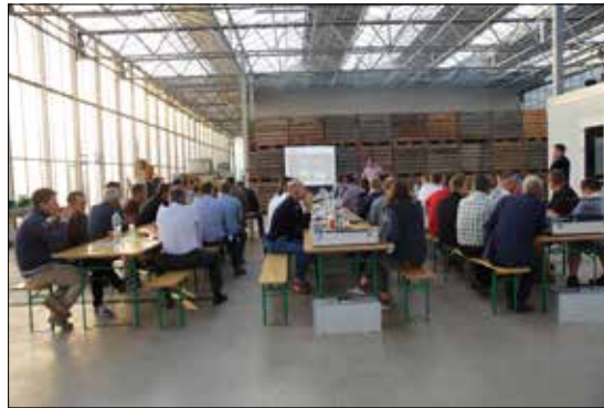
Unternehmertagung Gemüse Schweiz im Seeland BE/FR.