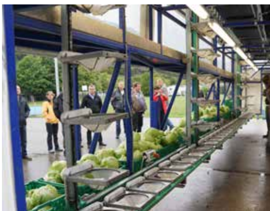
Le séminaire des entrepreneurs maraîchers suisses du 17 au 18 septembre 2015 dans le canton d'Argovie.

Le séminaire des entrepreneurs maraîchers suisses a également fêté une première. En effet, les 17 et 18 septembre lors du séminaire avec la visite de cinq exploitations dans le canton d'Argovie, des thèmes sur la conduite d'entreprise ont été abordés sous l'angle de l'économie d'entreprise. Le séminaire organisé par la CCM tiendra davantage compte de ce thème et servira en outre de plate-forme pour la publication et la présentation des résultats du projet. La CCM en sa qualité de pilote et de coordinatrice de projet est persuadée que le projet générera de la plus-value à la branche déjà au cours de la première année.