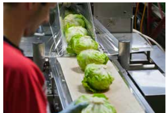
Présentation spéciale «Hygiène dans la culture maraîchère».