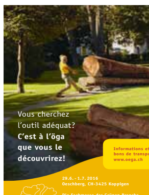
Annonce pour l'öga 2016.