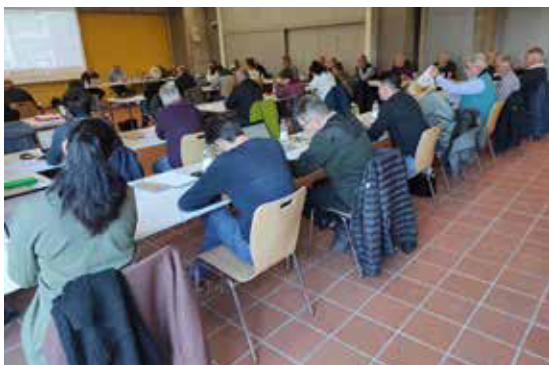
Forum Recherche Légumes 2021 à Koppigen.

Alors que le Forum Recherche Légumes a dû être organisé virtuellement, pour la première fois l'année précédente, en raison de la pandémie, les membres du FRL ont pu se retrouver à la mi-novembre 2021 à Oeschberg, pour la réunion annuelle organisée par la CCM. Les participants ont ainsi pu débattre vivement des nouvelles demandes soumises, ainsi que des 79 demandes d'extension et des 72 indications de lacunes phytosanitaires identifiées. Ils les ont classées par ordre de priorité et le comité les a transmises aux prestataires que sont Agroscope, le FiBL ou d'autres partenaires de recherche selon les demandes ( www.ffg.szg.ch ).