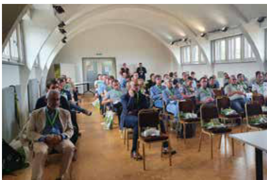
Conférence OCCM 2021 à Morges.

Afin de soutenir numériquement les processus et l'échange de connaissances au sein du réseau, une plateforme de réseau et de connaissances devrait être mise à disposition. Les clarifications sur le contenu et le format de cette plateforme sont en cours.