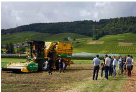
Séminaire des entrepreneurs Vaud 2021.