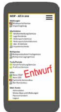
Le développement ultérieur comprend également un APP.

Depuis le 1er janvier 2020, la communauté d'intérêt pour l'importation et l'exportation (CI-PIE) est responsable des questions d'importation et d'exportation de fruits et légumes. La CI-PIE est issue de Swiss-légumes qui a été dissoute. Elle conclut des contrats avec l'OFAG. Pour des prestations ultérieures au niveau du recensement/de la fourniture de données de marché, la CCM sera mandaté en tant que prestataire par la CI-PIE.