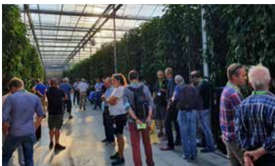
Séminaire des entrepreneurs Thurgovie 2020.