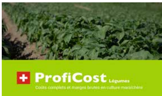
ProfiCost Légumes – dès maintenant avec variante standard pommes de terre.

Une autre plateforme importante, pour l'échange et le réseau au niveau de l'économie d'entreprise maraîchère, est le séminaire des entrepreneurs maraîchers suisses. La 6ème édition du séminaire des entrepreneurs, qui a eu lieu les 17 et 18 septembre, a emmené 40 participantes dans des entreprises maraîchères dans le canton de Thurgovie et la région du lac de Constance (Bade-Wurtemberg). Lors de cette manifestation de formation continue, organisée en collaboration avec le centre de formation et de conseils Arenenberg, les professionnels de la culture maraîchère ont pu prendre connaissance des évolutions récentes dans les domaines de l'énergie, de l'automatisation et de l'innovation maraîchère.