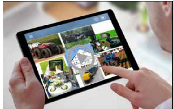
L'expo spéciale «La culture maraîchère informatisée».

En plus de l'organisation de la présentation spéciale «Légumes», la CCM est responsable des activités médiatiques de l'ensemble de la foire. www.oega.ch