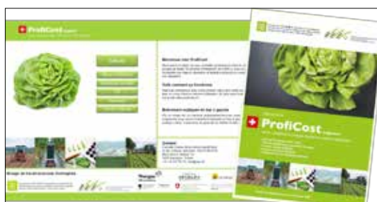
ProfiCost est disponible en logiciel et en version imprimée.

Même si les travaux d'aboutissement du projet «2015-17» sont encore en cours, on peut d'ores et déjà déclarer qu'en résumé la CCM a réussi au cours des 3 dernières années, avec à la collaboration de ses partenaires de projet, à faire en sorte que de précieuses valeurs ajoutées soient générées dans le système des connaissances en matière d'économie d'entreprise dans la culture maraîchère et que les objectifs visés aient pu en majorité être atteints. Le GT Economie d'entreprise a été le moteur des sous-projets mis en œuvre. Il a bénéficié d'un solide réseau de représentants de la production, de la formation, du conseil et de la recherche pour réaliser ses tâches. La CCM est prêt à faire en sorte que les principes de collaboration développés se poursuivent à long terme et durablement, même après la fin du projet.