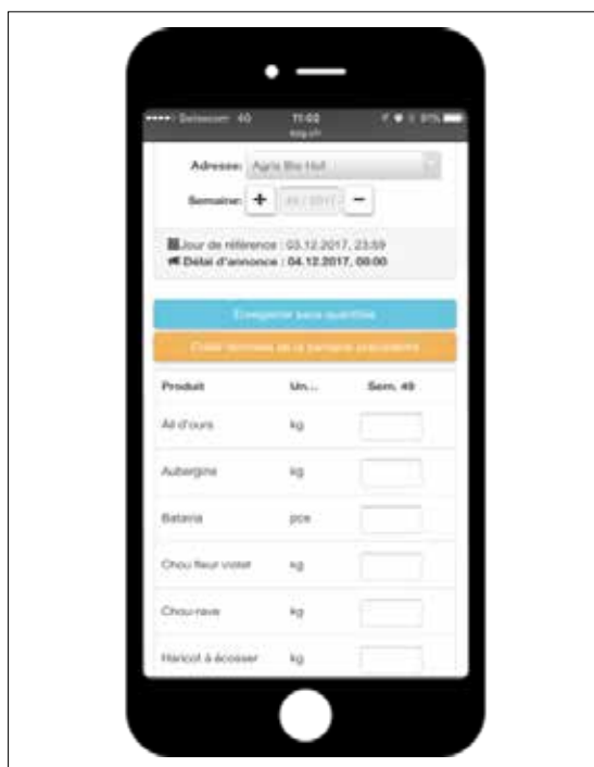
La nouvelle app d'annonce.