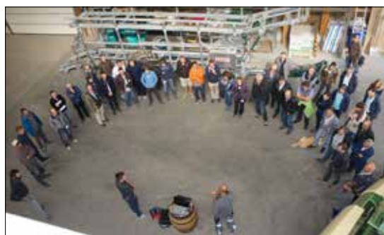
Séminaire des entrepreneurs maraîchers de Suisse en Valais.