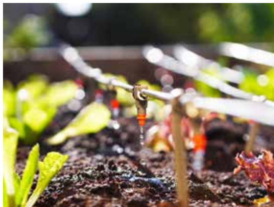
L'exposition spéciale « chaque goutte compte » porte sur l'utilisation durable des ressources en eau et du sol dans la production végétale.

À la fin de l'année, 380 exposants se sont déjà inscrits à l'ÖGA, qui aura lieu du 24 au 26 juin 2020, dont une vingtaine d'exposants qui participeront à l'exposition spéciale sur les légumes « Chaque goutte compte ». Cette exposition spéciale, tournée vers l'avenir, sera entièrement consacrée à la gestion de l'eau et du sol. Les services de la CCM sont entièrement rémunérés par la société simple ÖGA.