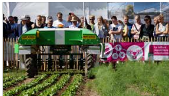
ÖGA Expo spéciale «Culture maraîchère informatisée».

connaissances dans la culture maraîchère, par le biais d'un réseau et d'un faisceau de compétences dans le domaine de la recherche, des essais, de la formation et de la vulgarisation. Pour intégrer le mieux possible le centre dans des structures en place (par ex. processus de priorisation du Forum Recherches Légumes) et pour assurer de bonnes relations avec les offices/services cantonaux de vulgarisation de toute la Suisse, la CCM reprend, en partenariat avec l'UMS, la direction et la coordination du projet. Ceci d'abord de manière limitée dans le temps en fonction de la phase de mise en œuvre et à la condition que : a) un centre national de compétence voie le jour (sans caractère régional) et que : b) l'UMS soutienne le projet sur le fond et avec du personnel. Comme partenaires dans la recherche, il y a Agroscope, HAFL et le FiBL. Sont par ailleurs participants dans la mise en œuvre: l'Inforama, l'Institut agricole de Grangeneuve, l'UMS, le Cercle conseil/vulgarisation légumes, GVBF, LOS, FFG/FRL. Le centre national de compétence légumes est ouvert à d'autres partenaires.