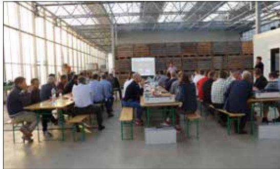
Séminaire des entrepreneurs maraîchers en Seeland BE/FR.