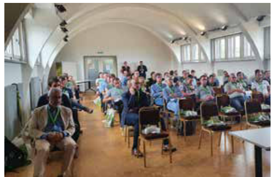
KZG-Konferenz, Morges, 2021.

Um die Prozesse und den Wissensaustausch innerhalb des Netzwerkes digital zu unterstützen, soll eine Netzwerk- und Wissensplattform zur Verfügung gestellt werden. Die Abklärungen über Inhalte und Format dieser Plattform sind im Gang.