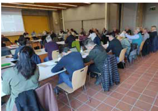
Forum Forschung Gemüse 2021 in Koppigen.

Nachdem das Forum Forschung Gemüse pandemiebedingt im Vorjahr zum ersten Mal virtuell durchgeführt werden musste, konnte die SZG die FFG-Mitglieder Mitte November wiederum auf den Oeschberg einladen. Das Gremium konnte so neu eingereichte sowie bestehende 79 Extension- und 72 Pflanzenschutz-Probleme (Lückenindikationen) diskutieren, priorisieren und im positiven Fall an die Leistungserbringer Agroscope, FiBL und weitere Forschungspartner übergeben. www.ffg.szg.ch .