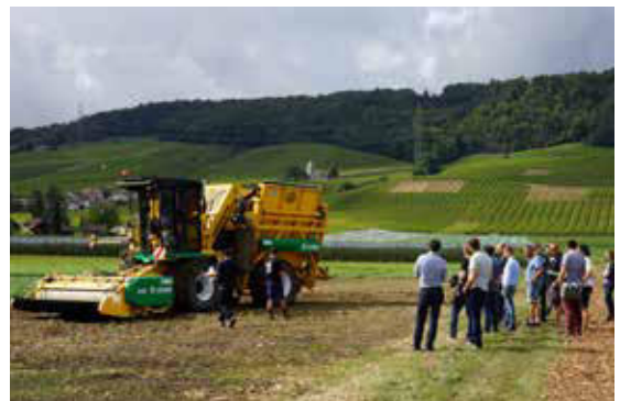
Unternehmertagung Waadt 2021.