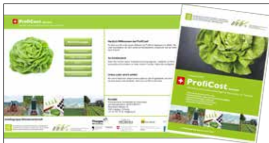
ProfiCost ist als Software und Druckversion erhältlich.

ten Teilprojekten war die AG Betriebswirtschaft, mit welcher während des Projekts ein starkes Netzwerk aus Vertretern von Produktion, Bildung, Beratung und Forschung aufgebaut werden konnte. Die SZG ist gewillt dafür zu sorgen, dass diese mit dem Projekt erarbeiteten Grundlagen auch nach Projektende langfristig und nachhaltig weitergeführt werden.