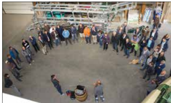
Unternehmertagung Gemüse Schweiz im Wallis.